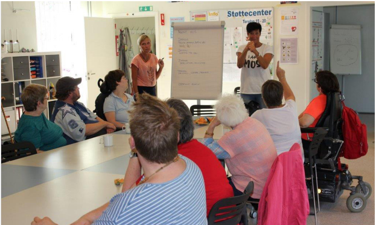
En onsdag aften på Støttestcenter Hovedstaden kan også have karakter af et møde.

De unge har svært ved at følge med og er ofte meget rådvilde, når de er færdige med grundskolen. Måske har de forsøgt sig med en ungdomsud-dannelse af en slags og oplevet, at de ikke kunne følge med – og det udfordrer dem psykisk. Derfor oplever støttestreet også lige nu, at de tager imod flere unge, som er psykisk skrøbelige. Nogle bliver indlagt på psykiatrisk afdeling. Uanset hvad så har de unge brug for støtte i deres hverdag. De skal måske flytte hjemmefra og klare sig selv, eller de skal ud på arbejdsmarkedet.